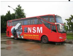
จุดจอดรถบัส